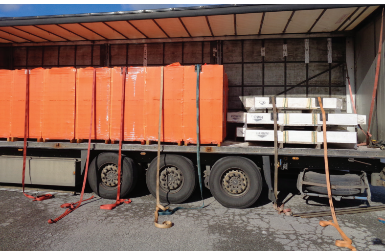
bauroc bloku paletes un pārsedzes autokrāvā Поддоны с блоками bauroc и перемычки в кузове автомобиля