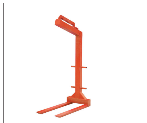
Палету dakša palešu ar blokiem pārvietošanai Вилочный погрузчик для подъема поддонов с блоками